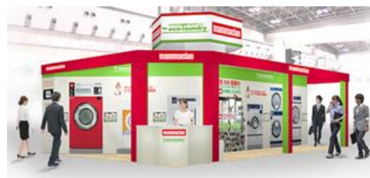
マンマチャオの出展ブースイメージ(小間番号 5447)